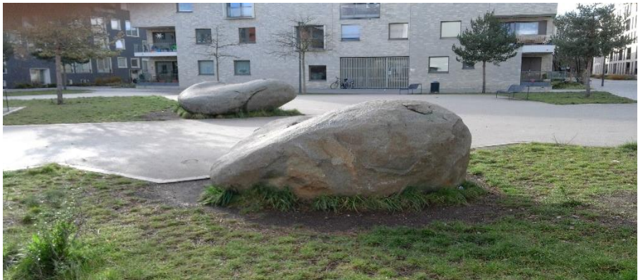
4b. Heinz Mohnen Platz > Platz der Kinderrechte

Der dritte Findling liegt separat auf dem hinteren Teil des Heinz-Mohnen-Platzes, der (z.Zt. schon symbolisch) umbenannt werden soll in „Platz der Kinderrechte und trägt die Widmung: „für alle Kinder die zukünftig hier leben werden“.