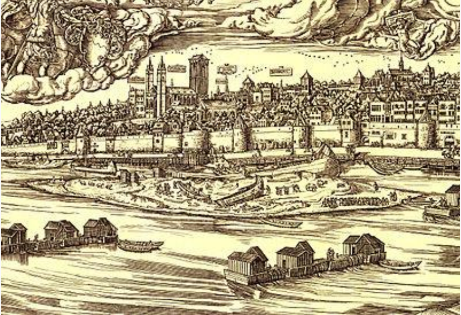
Kölner Rheinmühlen 1531, Anton Woensam

Der Standort der Stadt Köln ist, was die Gewinnung von Energie aus Wasserkraft unter den Bedingungen des Altertums angeht, ungünstig gewählt. Der Mangel an geeigneten Bächen im Stadtgebiet erzwang im Mittelalter die risikoreiche Nutzung des breiten, kaum regulierten Stroms zum Antrieb von Getreidemühlen , um die bevölkerungsreiche Metropole mit Mehl zu versorgen.