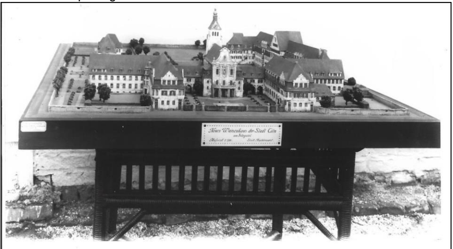
3. Waisenhaus Köln-Sülz, Sülzgürtel